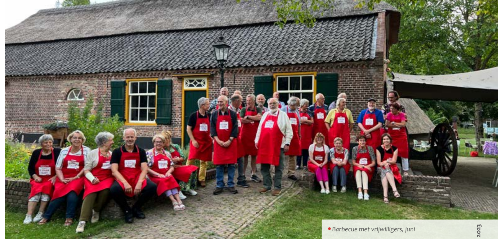
• Barbecue met vrijwilligers, juni