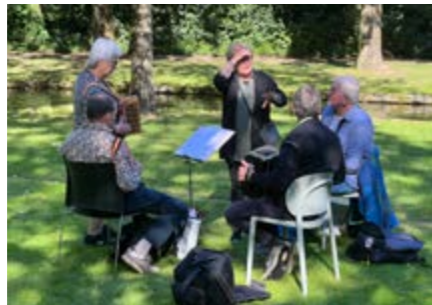
• Mondharmonica en trekzakfestival tijdens CityFest

Het museum is continue bezig met het verbeteren van de bedrijfsvoering. Dat varieert van het aanbieden van trainingen voor Bedrijfshulpverlening tot het verder automatiseren van de boekhouding en facturering. In het verslagjaar werd tevens een verandering van ICT-partner doorgezet (ITZeker werd COM4). Een hele digitale verhuizing naar 'de Cloud' met uiteindelijk een efficiëntere manier van werken tot gevolg.