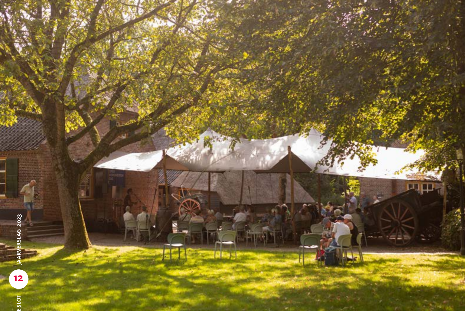
• Open Monumentendag