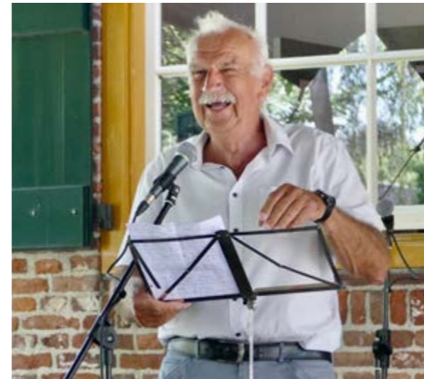
• Open Monumentendag