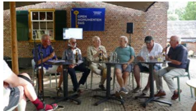
• De leden van de bekende groep 'the Evergreens' tijdens de Open Monumentendag in september