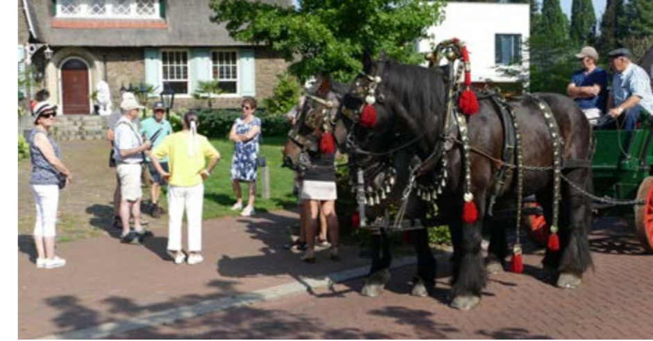
• Rondleiding door Zeelst tijdens Open Monumentendag