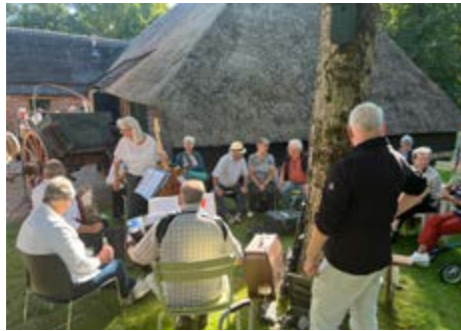
• Mondharmonica en trekzakfestival tijdens CityFest