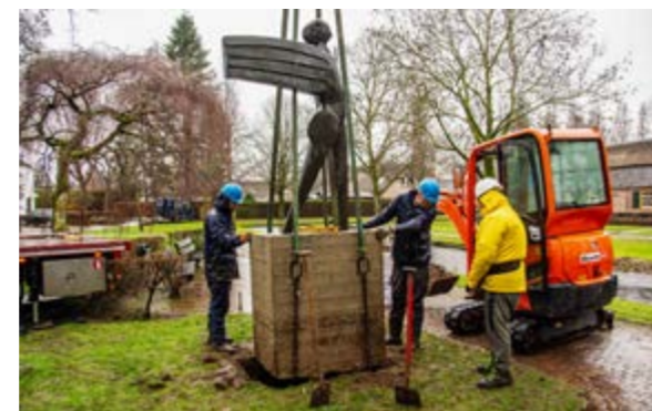
• Plaatsing beeld Daidalos van hoek Burg. Van Hoofflaan – Bossebaan naart museumpark, op 12 januari