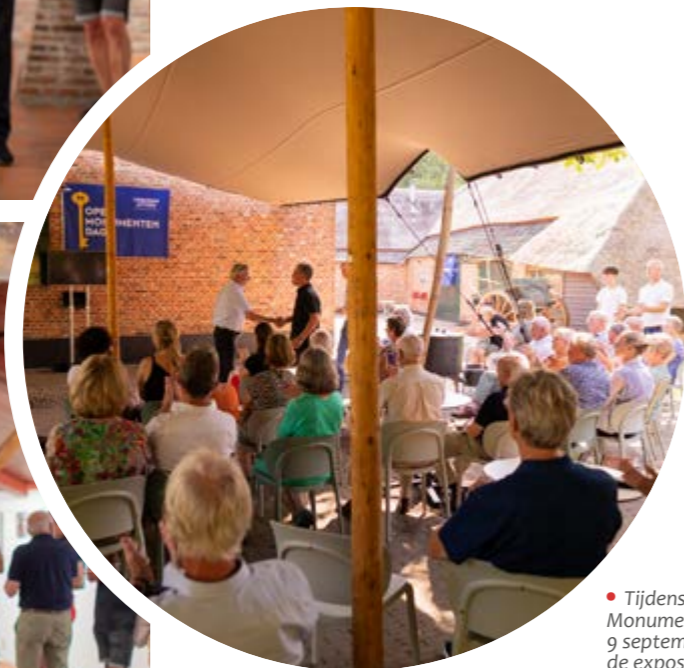
• Tijdens Open Monumentendag op 9 september opende de expositie 'Het trekpaard leeft'.