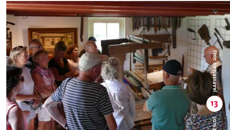
• Rondleiding in het bakhuisje