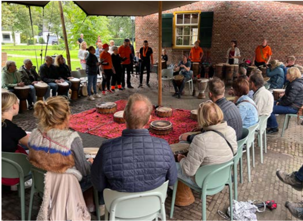
• Workshops tijdens City Fest, trommelen met de groep!